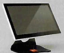
Poids 4960 g