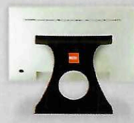
Largeur 390 mm