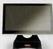
Hauteur 324 mm